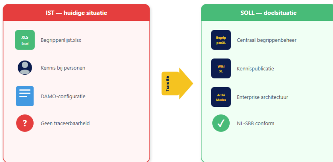
Figuur 2: Van verspreide begrippen naar structureel beheer