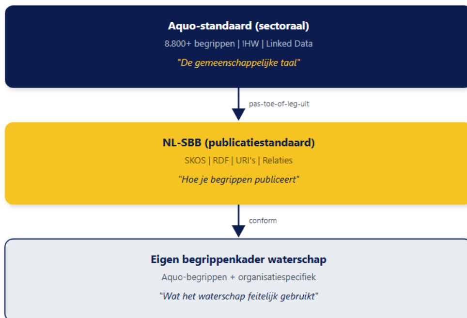
Figuur 1: De drie lagen van begrippenbeheer